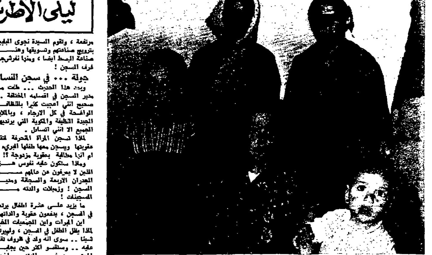
هؤلاء الأبطال الأبرياء... فحيا لأعمالهم التي تكفيهم، كعب عليهم أن يرتفعوا إلى السجن!

متوقفة... عبرا ونما ومذابا، وانطلقا من حقيقة كونهم انسانا فردا، على حقيقته ان يحاول كسبه وان خذل مرة. أنتجت فكرة تكوين جمعية رعاية السجناء في عمان - لتبني فكرة رعاية السجناء نفسيا وماديا، وتنضم له طريفا يسلكه حين يودع البوابه الرهيبة ولتاويل المجتمع ليقبل تلك الوائد من مكان لهم عليه كثر من التفتحات. ومن أجل الزووف على ما انجزته الجمعية في سبيل تحسين ظروف السجن النفسية - وتأهيله للائحة المجتمع من جديد